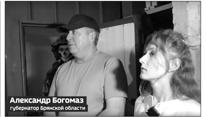
Александр Богомаз губернатор Брянской области

Для каждого члена группы «Вместе_Z» слова «ВМЕСТЕ ПОБЕДИМ!» стали и призывом, и девизом. Они по зову сердца отдают частичку своего тепла и заботы тем, кому сейчас это просто необходимо.